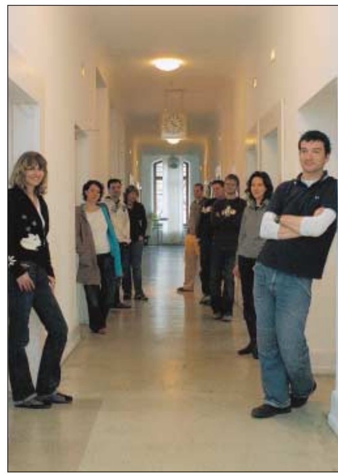
Der lange Flur in den Räumen der Kommunikationsagentur „Die Firma“ erinnert noch an die alte Klinik.

Hier ist die alte Klinik noch Gegenwart in der Innenarchitektur. Ein ellenlanger Flur,