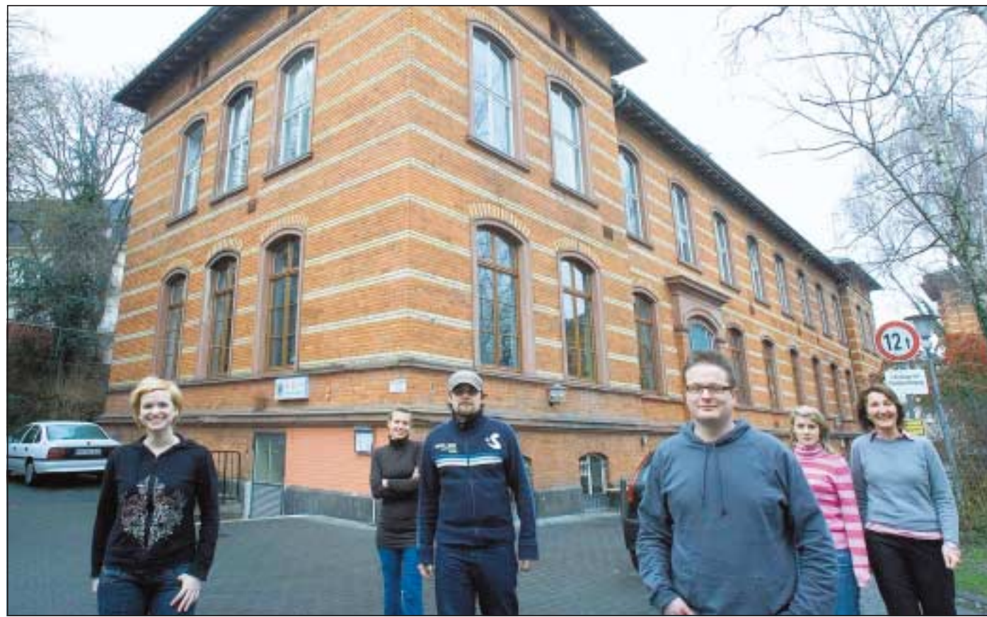
Ein Kreativzentrum ist auf dem Areal der früheren Städtischen Kliniken an der Schwalbacher Straße entstanden. Die Freie Kunstschule ist in die Friedrichstraße umgezogen. Hier Mitarbeiter der Werbeagentur Scholz & Volkmer.

Sie alle haben auch ein weiteres gemeinsam. Sie brauchen eine besondere Arbeitsatmosphäre, finden es, wie einer es ausdrückt, „grandios, so viel Platz über dem Kopf zum Denken zu haben“. Vor allem aber benötigen sie reichlich Raum. Die denkmalgeschützten Bauten sind im Besitz der städti-