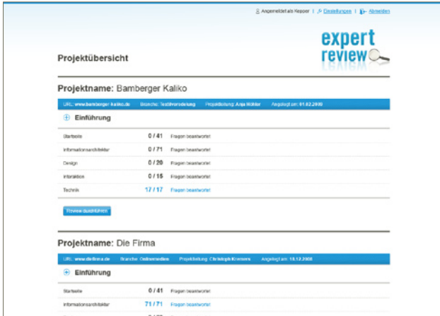
Startseite des softwaregestützten EXPERT REVIEWS mit Aktivitätsübersicht