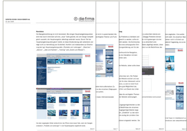
Seitenauszug aus dem schriftlichen Ergebnisbericht mit zahlreichen Screenshots